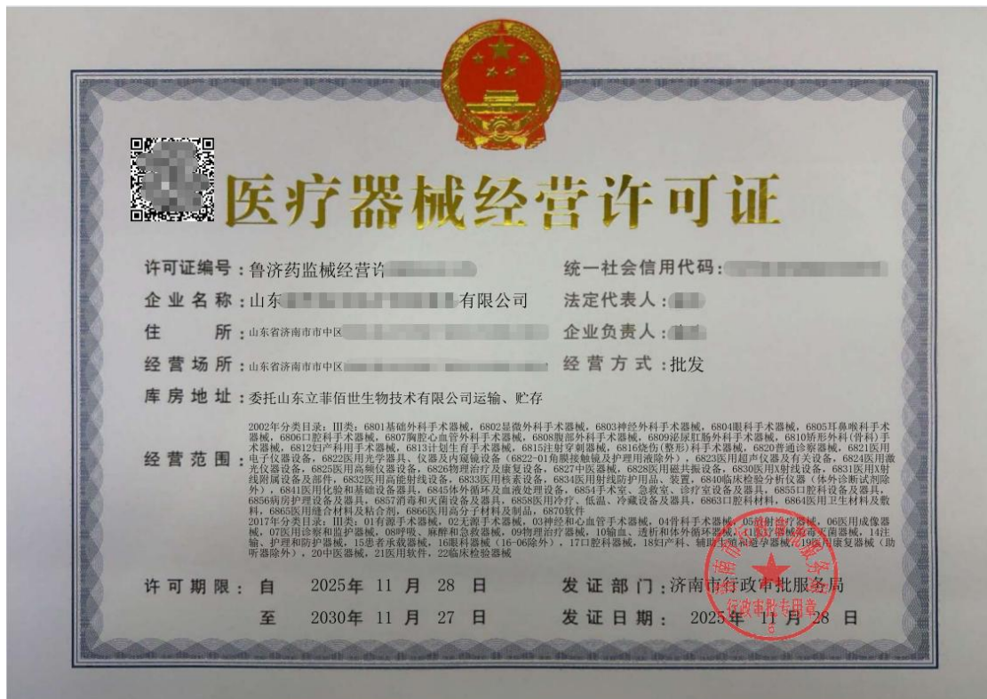
图：电子版医疗器械经营许可证