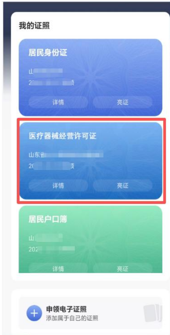
图：已申请证照列表